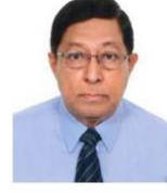
চেয়ারম্যান বাংলাদেশ অ্যাক্রেডিটেশন কাউন্সিল (বিএসি)